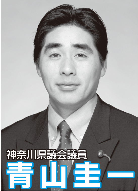
神奈川県議会議員