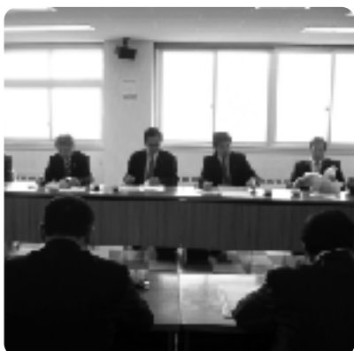
※まちづくり委員会メンバーと室蘭市役所にて

A 平成20年12月に経済局金融課と中小企業溝口事務所に嘱託職員を新たに各1名配置し、迅速な業務の執行体制を整えた。また、国への働きかけについては、指定業種の指定を受けていない配線器具、配線付属品製造業などについても機会を捉えて働きかけていく。